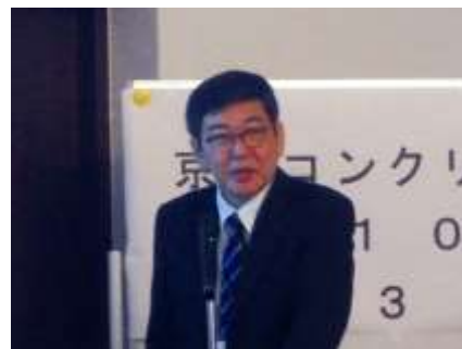
▲ 林 先生の講演