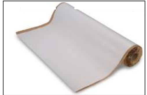
プロコンシート一般用

コンクリートの型枠に貼るだけで、打設時の水と反応を素早く適切に促し、コンクリート本来の強度を引き出せる土木・建築現場の革命ツールです。